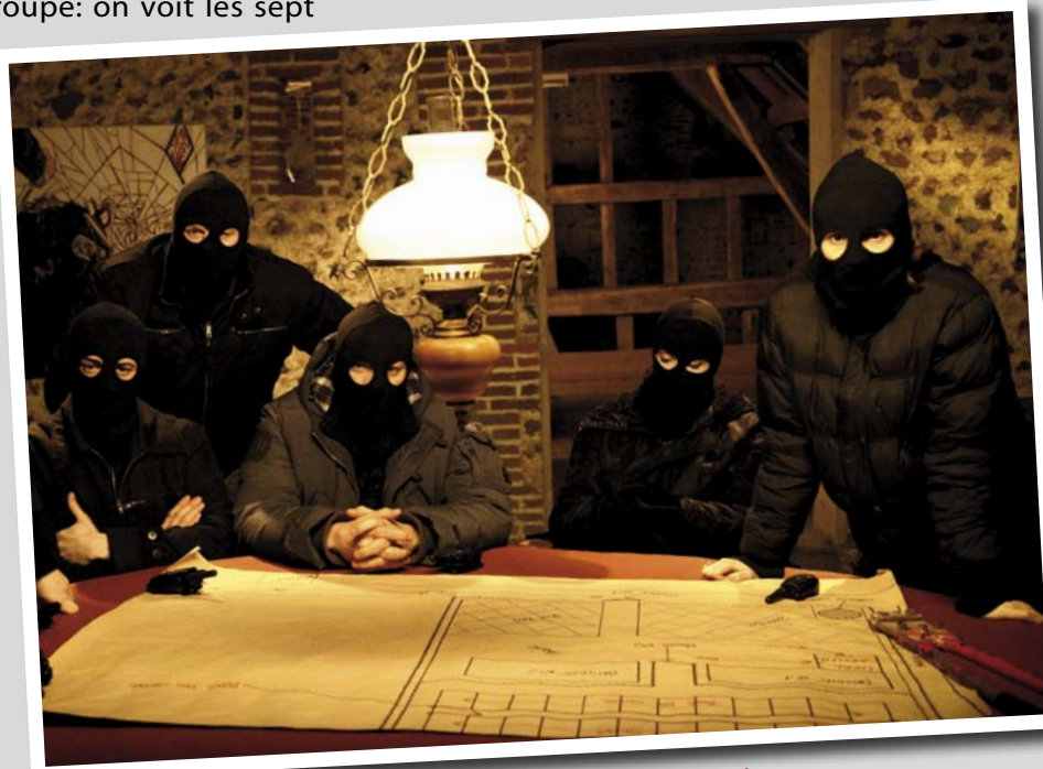
Une scène du film, que l'on devine cruciale...

JL: Lors de la création d'A.L.F. en 1967, le mot d'ordre était de ne faire du mal